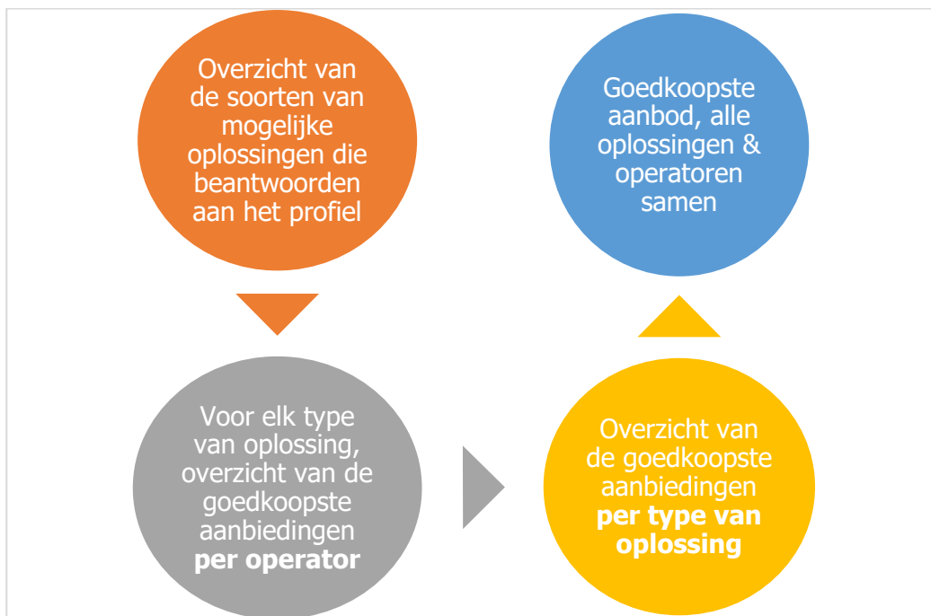
Figuur 1. Proces van definiëring van het goedkoopste aanbod per gezinsprofiel