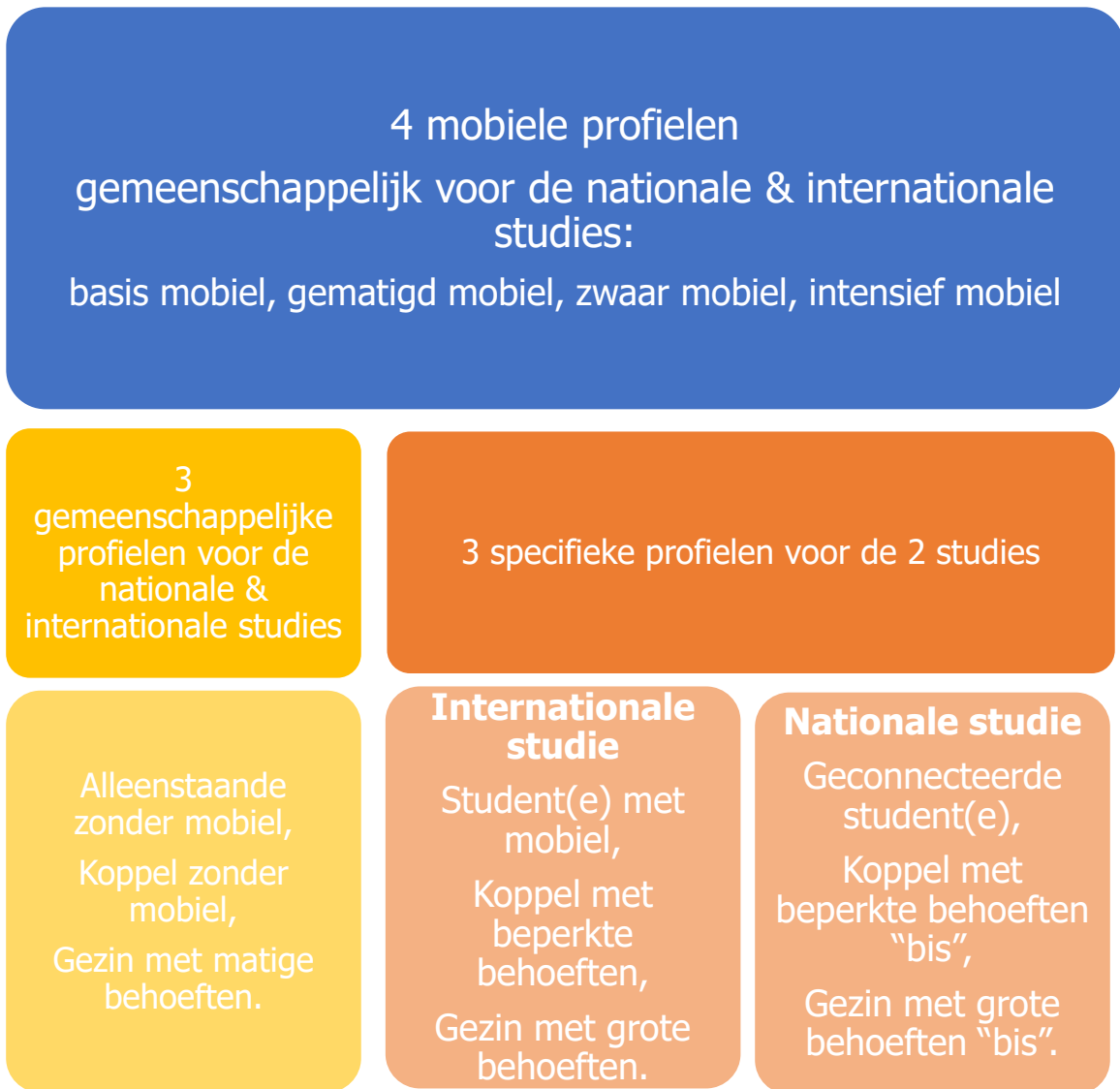
Figuur 2. Samenvatting van de voorgestelde profielen